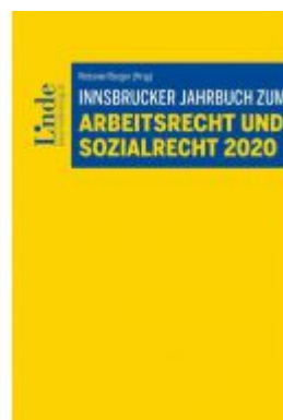
Innsbrucker Jahrbuch zum Arbeits- und Sozialrecht 2020 Ladenpreis: 52,00 EUR