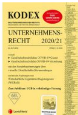
KODEX Unternehmensrecht 2020/21 Ladenpreis: 37,50 EUR

Wir haben andere Produkte gefunden, die Ihnen gefallen könnten!