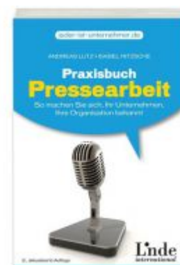
Praxisbuch Pressearbeit Ladenpreis: 18,40 EUR