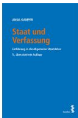
Staat und Verfassung Ladenpreis: 38,00EUR