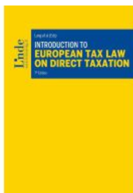
Introduction to European Tax Law on Direct Taxation Ladenpreis: 58,00EUR