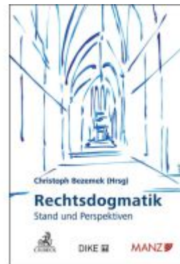
Rechtsdogmatik - Stand und Perspektiven Ladenpreis: 90,00EUR