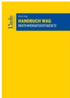
Handbuch WAG | Wertpapieraufsichtsgesetz Ladenpreis: 140,00EUR