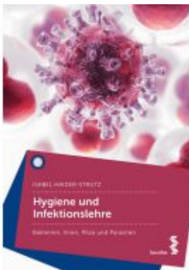
Hygiene und Infektionslehre Ladenpreis: 27,90EUR

Wir haben andere Produkte gefunden, die Ihnen gefallen könnten!