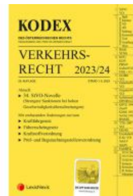
KODEX Verkehrsrecht 2023/24 - inkl. App Ladenpreis: 95,00EUR