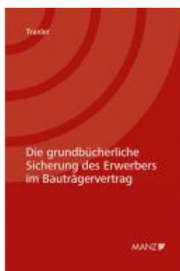
Die grundbücherliche Sicherung des Erwerbers im Bauträgervertrag Ladenpreis: 44,00EUR