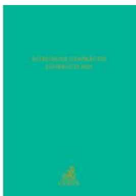
Bitburger Gespräche Jahrbuch 2024 Ladenpreis: 101,80EUR