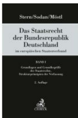
Das Staatsrecht der Bundesrepublik Deutschland im europäischen Staatenverband Band I: Grundlagen und Grundbegriffe des Staatsrechts, Strukturprinzipien der Verfassung Ladenpreis: 192,50EUR