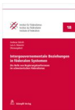
Intergouvernementale Beziehungen in föderalen Systemen Ladenpreis: 116,40EUR