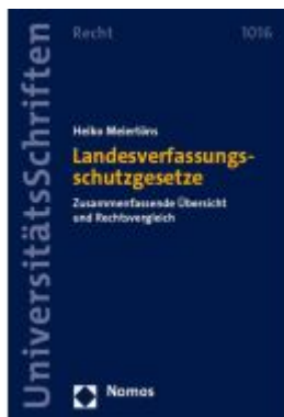
Landesverfassungsschutzgesetze Ladenpreis: 35,00EUR

Wir haben andere Produkte gefunden, die Ihnen gefallen könnten!