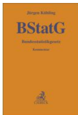
Bundesstatistikgesetz Ladenpreis: 122,40EUR