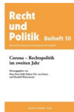
Corona – Rechtspolitik im zweiten Jahr. Ladenpreis: 71,90EUR