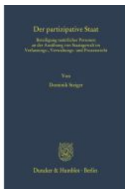
Der partizipative Staat. Ladenpreis: 154,10EUR