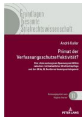
Primat der Verfassungsschutzeffektivität Ladenpreis: 74,00EUR