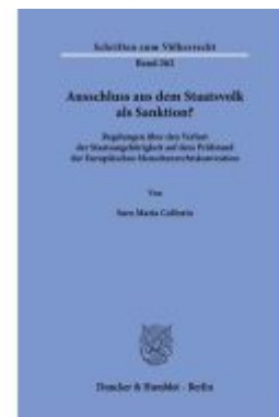
Ausschluss aus dem Staatsvolk als Sanktion? Ladenpreis: 92,50EUR