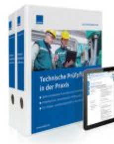
Technische Prüfpflichten in der Praxis Ladenpreis: 239,80EUR