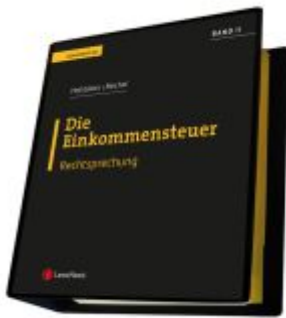
Die Einkommensteuer (EStG 1988) Band II - Rechtsprechung Ladenpreis: 325,00EUR