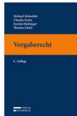
Vergaberecht Ladenpreis: 36,00EUR