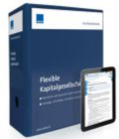
Mustersammlung Flexible Kapitalgesellschaft Ladenpreis: 250,80EUR