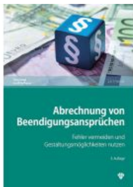
Abrechnung von Beendigungsansprüchen Ladenpreis: 29,70EUR