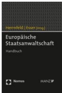
Europäische Staatsanwaltschaft Ladenpreis: 98,00EUR