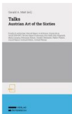
Talks Ladenpreis: 38,00EUR