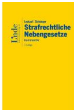
Leukauf/Steininger Strafrechtliche Nebengesetze Ladenpreis: 198,00EUR

Wir haben andere Produkte gefunden, die Ihnen gefallen könnten!