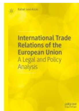
International Trade Relations of the European Union Ladenpreis: 109,99EUR