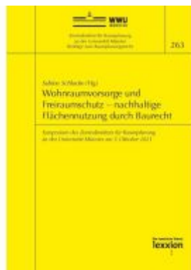
Wohnraumvorsorge und Freiraumschutz – nachhaltige Flächennutzung durch Baurecht Ladenpreis: 31,90EUR