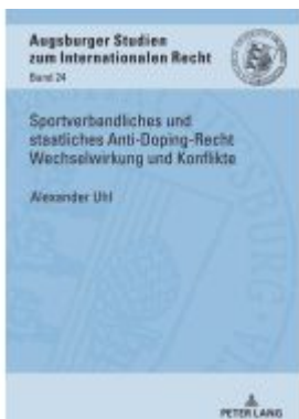
Sportverbandliches und staatliches Anti-Doping-Recht Wechselwirkung und Konflikte Ladenpreis: 67,80EUR