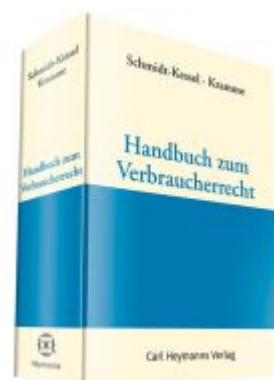
Handbuch Verbraucherrecht Ladenpreis: 142,90EUR