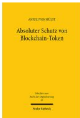
Absoluter Schutz von Blockchain-Token Ladenpreis: 117,20EUR