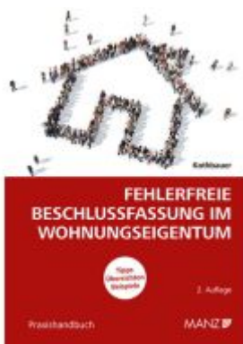
Fehlerfreie Beschlussfassung im Wohnungseigentum Ladenpreis: 32,00EUR