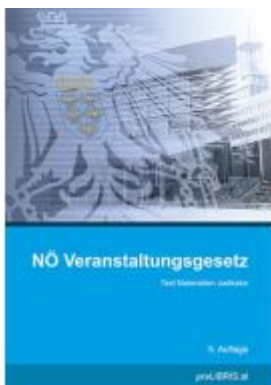
NÖ Veranstaltungsgesetz Ladenpreis: 15,00EUR