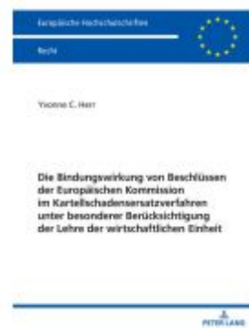
Die Bindungswirkung von Beschlüssen der Europäischen Kommission im Kartellschadensersatzverfahren unter besonderer Berücksichtigung der Lehre der wirtschaftlichen Einheit Ladenpreis: 77,10EUR