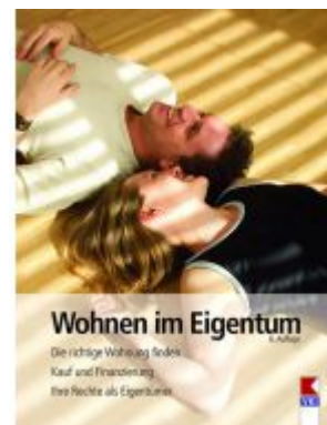
Wohnen im Eigentum Ladenpreis: 19,90 EUR