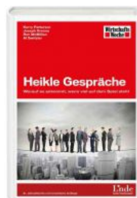
Heikle Gespräche Ladenpreis: 19,90 EUR