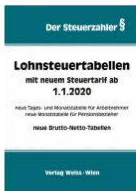
Lohnsteuertabellen mit neuem Steuertarif ab 1.1.2020 Ladenpreis: 34,10 EUR