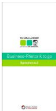
Business-Rhetorik to go Ladenpreis: 19,80 EUR

Wir haben andere Produkte gefunden, die Ihnen gefallen könnten!