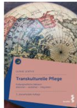
Transkulturelle Pflege Ladenpreis: 24,90 EUR