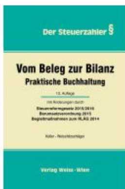
Vom Beleg zur Bilanz Ladenpreis: 64,90 EUR