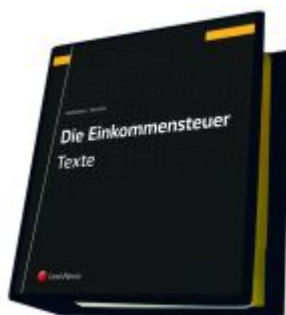
Die Einkommensteuer (EStG 1988) Band I - Texte Ladenpreis: 287,00 EUR