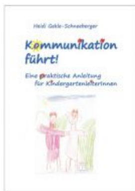
Kommunikation führt! Ladenpreis: 19,90 EUR