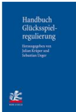
Glücksspielregulierung Ladenpreis: 102,80EUR

Wir haben andere Produkte gefunden, die Ihnen gefallen könnten!