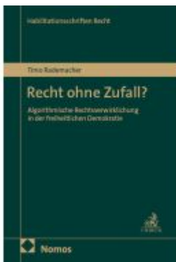
Recht ohne Zufall? Ladenpreis: 204,60EUR