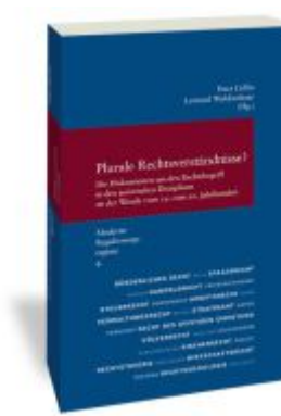
Plurale Rechtsverständnisse? Ladenpreis: 71,00EUR