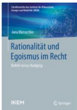
Rationalität und Egoismus im Recht Ladenpreis: 113,07EUR