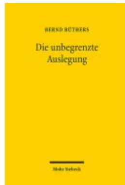
Die unbegrenzte Auslegung Ladenpreis: 29,90EUR