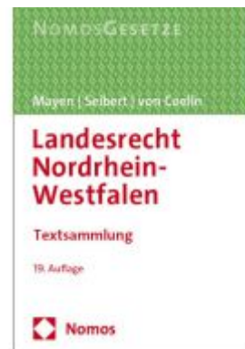
Landesrecht Nordrhein-Westfalen Ladenpreis: 30,80EUR