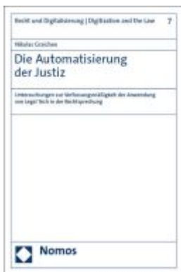
Die Automatisierung der Justiz Ladenpreis: 112,10EUR