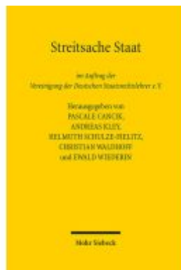
Streitsache Staat Ladenpreis: 163,50EUR