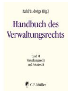
Handbuch des Verwaltungsrechts Ladenpreis: 287,90EUR