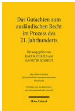
Das Gutachten zum ausländischen Recht im Prozess des 21. Jahrhunderts Ladenpreis: 107,00EUR