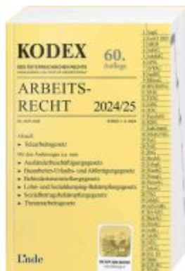
KODEX Arbeitsrecht 2024/25 Ladenpreis: 37,00EUR