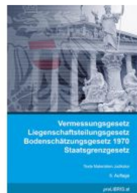
Vermessungsgesetz / Liegenschaftsteilungsgesetz / Bodenschätzungsgesetz 1970 / Staatsgrenzengesetz Ladenpreis: 28,00EUR