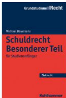
Schuldrecht Besonderer Teil Ladenpreis: 20,60EUR