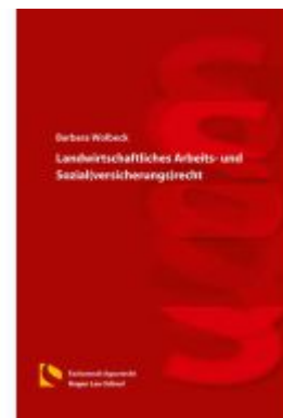
Landwirtschaftliches Arbeits- und Sozial(versicherungs)recht Ladenpreis: 19,50EUR