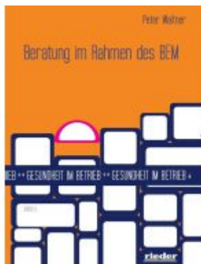
Beratung im Rahmen des BEM Ladenpreis: 19,10EUR

Wir haben andere Produkte gefunden, die Ihnen gefallen könnten!