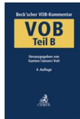
Beck'scher VOB-Kommentar / Beck'scher VOB-Kommentar VOB Teil B Ladenpreis: 276,60EUR