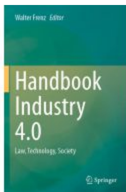
Handbook Industry 4.0 Ladenpreis: 241,99EUR