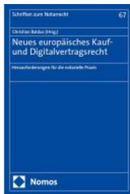
Neues europäisches Kauf- und Digitalvertragsrecht Ladenpreis: 40,10EUR