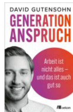
Generation Anspruch Ladenpreis: 22,70EUR