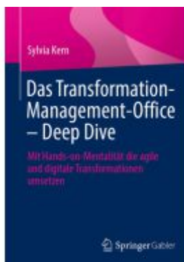
Das Transformation-Management-Office – Deep Dive Ladenpreis: 39,06EUR