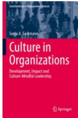
Culture in Organizations Ladenpreis: 153,99EUR