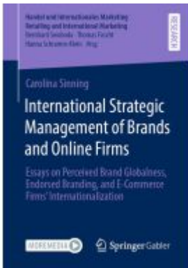
International Strategic Management of Brands and Online Firms Ladenpreis: 109,99EUR