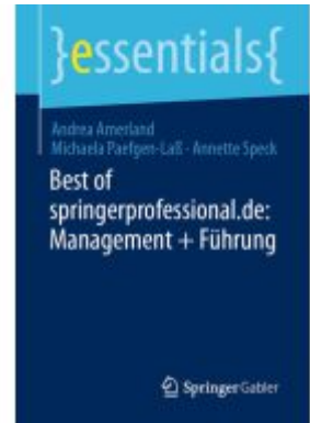
Best of springerprofessional.de: Management + Führung Ladenpreis: 15,41EUR