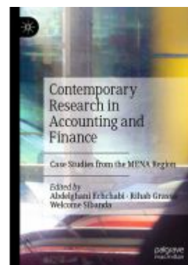
Contemporary Research in Accounting and Finance Ladenpreis: 175,99EUR