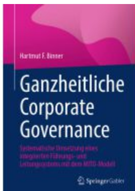
Ganzheitliche Corporate Governance Ladenpreis: 61,67EUR

Wir haben andere Produkte gefunden, die Ihnen gefallen könnten!