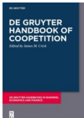
De Gruyter Handbook of Coopetition Ladenpreis: 139,95EUR