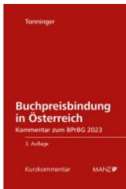
Buchpreisbindung in Österreich BPrBG 2023 Ladenpreis: 42,00EUR