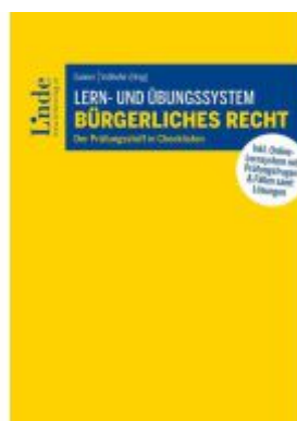
Lern- und Übungssystem Bürgerliches Recht Ladenpreis: 50,00EUR