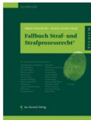
Fallbuch Straf- und Strafprozessrecht5 Ladenpreis: 44,90EUR