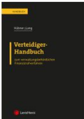
Verteidiger-Handbuch Ladenpreis: 54,00EUR