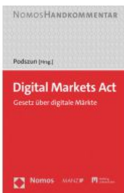
Digital Markets Act Ladenpreis: 134,00EUR