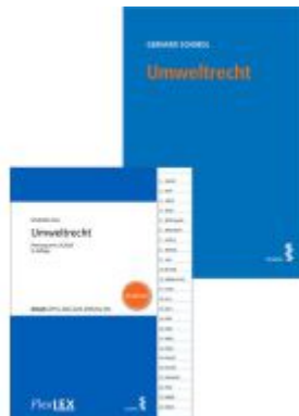
Kombipaket Umweltrecht und FlexLex Umweltrecht | Studium Ladenpreis: 53,00EUR