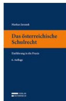
Das österreichische Schulrecht Ladenpreis: 49,00EUR