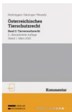
Österreichisches Tierschutzrecht Ladenpreis: 88,00EUR