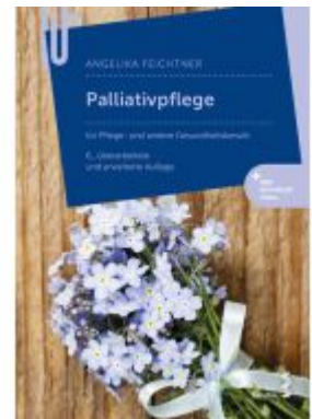
Palliativpflege Ladenpreis: 38,90EUR