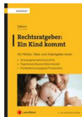
Rechtsratgeber: Ein Kind kommt Ladenpreis: 45,00EUR