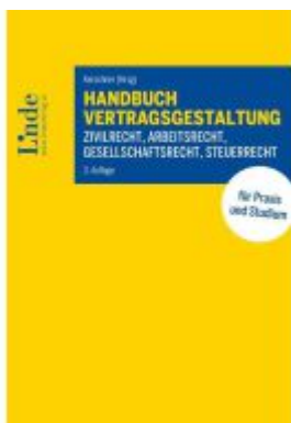
Handbuch Vertragsgestaltung Ladenpreis: 115,00EUR