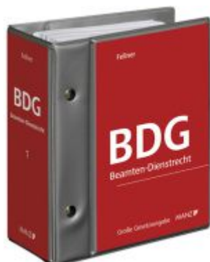
Beamten-Dienstrechtsgesetz Ladenpreis: 375,00EUR