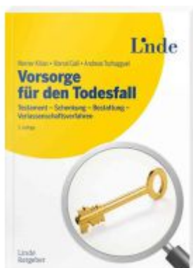
Vorsorge für den Todesfall Ladenpreis: 22,90EUR