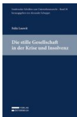
Die stille Gesellschaft in der Krise und Insolvenz Ladenpreis: 109,00EUR