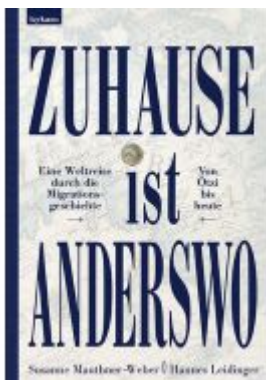
Zuhause ist anderswo Ladenpreis: 28,00EUR

Wir haben andere Produkte gefunden, die Ihnen gefallen könnten!