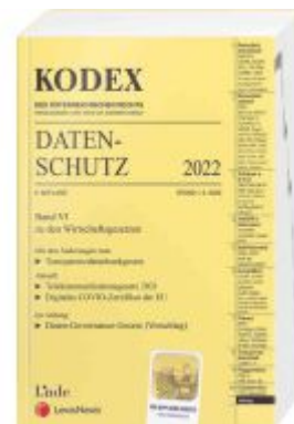
KODEX Datenschutz 2022 Ladenpreis: 65,00EUR