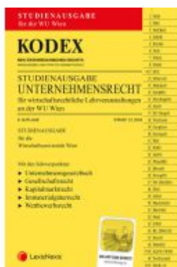
KODEX Unternehmensrecht für wirtschaftsrechtliche LVA 2024 - inkl. App Ladenpreis: 26,00EUR