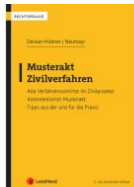
Musterakt Zivilverfahren Ladenpreis: 66,25EUR