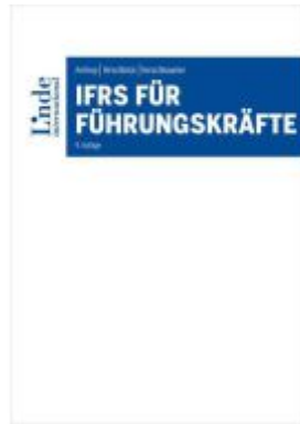
IFRS für Führungskräfte Ladenpreis: 54,00EUR