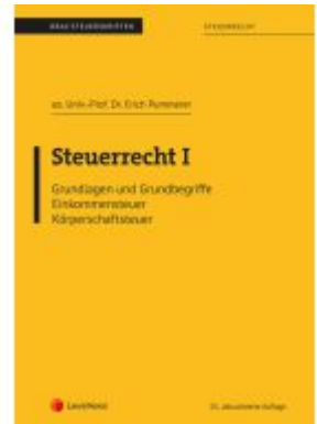
Steuerrecht I (Skriptum) Ladenpreis: 22,50EUR