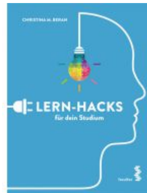
Lern-Hacks für dein Studium Ladenpreis: 14,90EUR