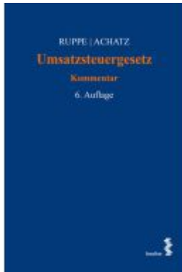
Umsatzsteuergesetz Ladenpreis: 378,00EUR