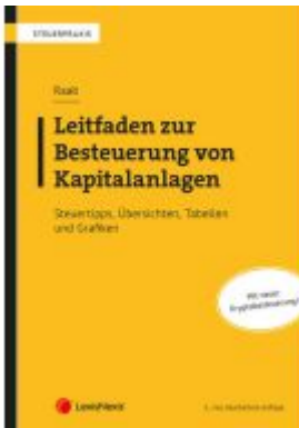
Leitfaden zur Besteuerung von Kapitalanlagen (KESt) Ladenpreis: 84,00EUR