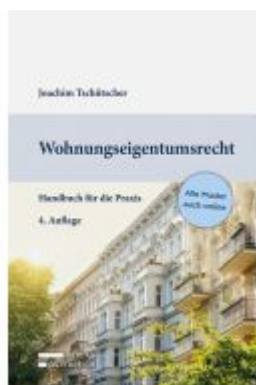
Wohnungseigentumsrecht Ladenpreis: 69,00EUR