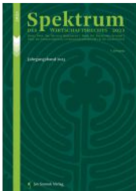
Spektrum des Wirtschaftsrechts Ladenpreis: 42,50EUR

Wir haben andere Produkte gefunden, die Ihnen gefallen könnten!