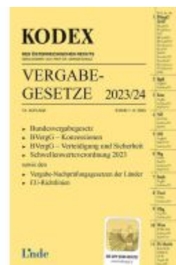
KODEX Vergabegesetze 2023/24 Ladenpreis: 55,00EUR