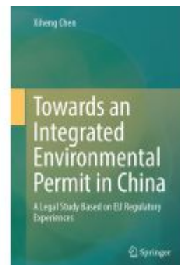
Towards an Integrated Environmental Permit in China Ladenpreis: 175,99EUR