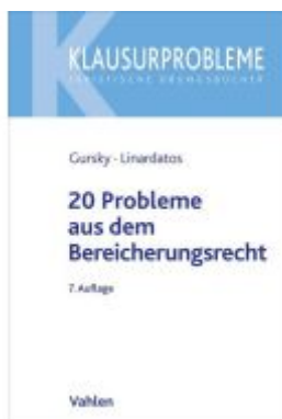
20 Probleme aus dem Bereicherungsrecht Ladenpreis: 20,40EUR