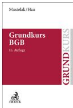
Grundkurs BGB Ladenpreis: 27,70EUR