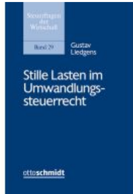
Stille Lasten im Umwandlungssteuerrecht Ladenpreis: 101,80EUR