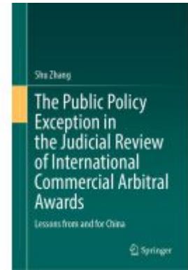
The Public Policy Exception in the Judicial Review of International Commercial Arbitral Awards Ladenpreis: 164,99EUR