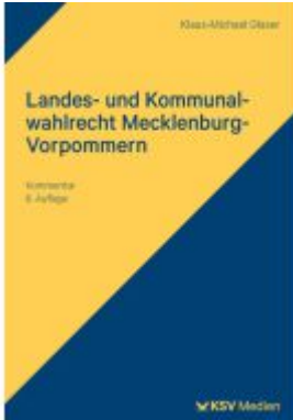
Landes- und Kommunalwahlrecht Mecklenburg-Vorpommern Ladenpreis: 60,70EUR