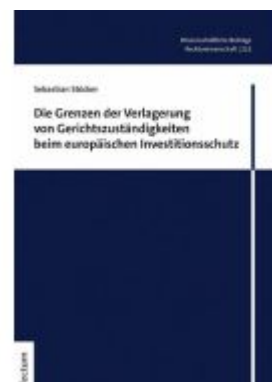
Die Grenzen der Verlagerung von Gerichtszuständigkeiten beim europäischen Investitionsschutz Ladenpreis: 65,80EUR