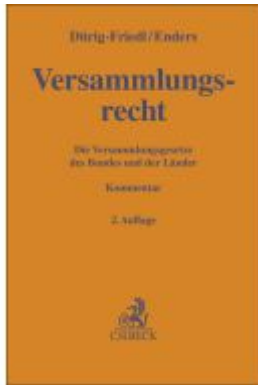
Versammlungsrecht Ladenpreis: 132,70EUR