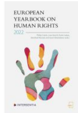
European Yearbook on Human Rights 2022 Ladenpreis: 171,00EUR