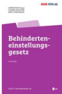
Behinderteneinstellungsgesetz Ladenpreis: 109,00EUR