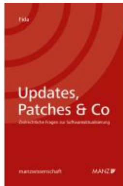
Updates, Patches & Co - Zivilrechtliche Fragen zur Softwareaktualisierung Ladenpreis: 59,00EUR