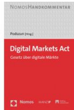
Digital Markets Act Ladenpreis: 134,00EUR