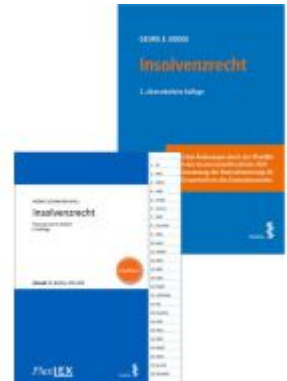
Kombipaket Insolvenzrecht und FlexLex Insolvenzrecht | Studium Ladenpreis: 47,00EUR