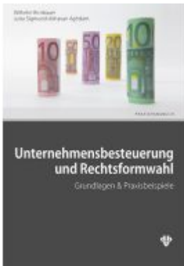
Unternehmensbesteuerung und Rechtsformwahl Ladenpreis: 46,00EUR