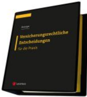
Versicherungsrechtliche Entscheidungen - aufbereitet für die Praxis Ladenpreis: 329,00EUR