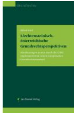
Lichtensteinisch-österreichische Grundrechtsperspektiven Ladenpreis: 39,90EUR