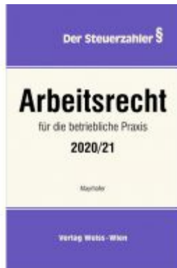
Arbeitsrecht für die betriebliche Praxis 2020/21 Ladenpreis: 85,80 EUR