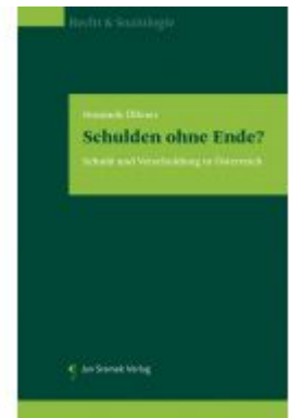
Schulden ohne Ende? Ladenpreis: 85,00 EUR