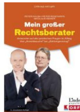
Mein großer Rechtsberater Ladenpreis: 29,90 EUR