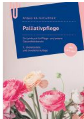
Palliativpflege Ladenpreis: 28,90 EUR