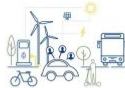
Praxishandbuch Nachhaltiges betriebliches Mobilitätsmanagement Ladenpreis: 62,00EUR