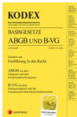
KODEX Basisgesetze ABGB und B-VG 2023/24 - inkl. App Ladenpreis: 15,00EUR