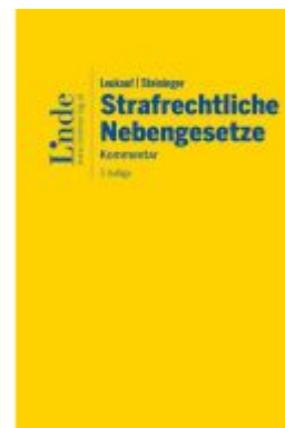
Leukauf/Steininger Strafrechtliche Nebengesetze Ladenpreis: 198,00EUR