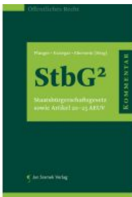
Kommentar zum StbG Staatsbürgerschaftsgesetz 1985 Ladenpreis: 248,00EUR