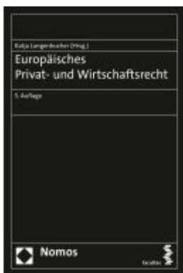
Europäisches Privat- und Wirtschaftsrecht Ladenpreis: 51,30EUR