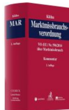
Marktmisbrauchsverordnung Ladenpreis: 189,00EUR