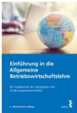
Einführung in die Allgemeine Betriebswirtschaftslehre Ladenpreis: 26,00EUR

Wir haben andere Produkte gefunden, die Ihnen gefallen könnten!