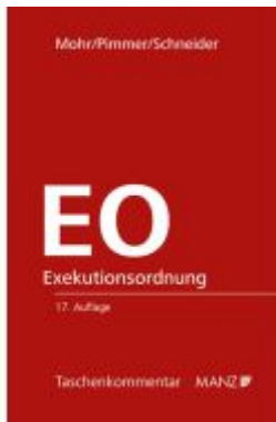
Exekutionsordnung - EO Ladenpreis: 108,00EUR