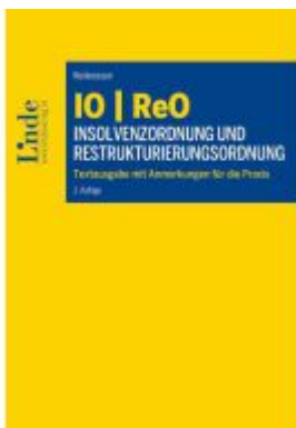
IO | ReO Insolvenzordnung und Restrukturierungsordnung Ladenpreis: 89,00EUR