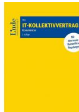
IT-Kollektivvertrag Ladenpreis: 58,00 EUR