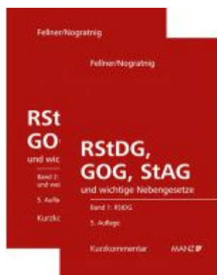
RStDG, GOG und StAG Richter- und StaatsanwaltschaftsdienstG, GerichtsorganisationsG und StaatsanwaltschaftsG Ladenpreis: 298,00 EUR