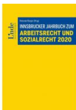
Innsbrucker Jahrbuch zum Arbeits- und Sozialrecht 2020 Ladenpreis: 52,00 EUR