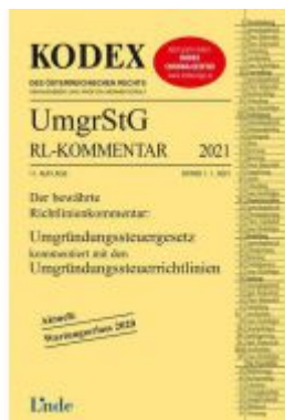
KODEX Umgründungssteuergesetz- Richtlinienkommentar 2021 Ladenpreis: 60,00 EUR

Wir haben andere Produkte gefunden, die Ihnen gefallen könnten!