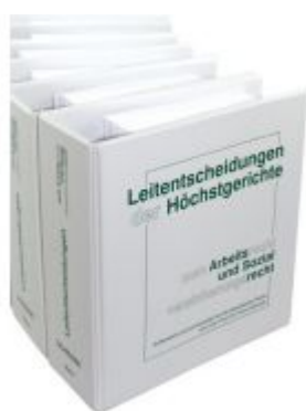
Leitentscheidungen der Höchstgerichte zum Arbeitsrecht und Sozialversicherungsrecht Ladenpreis: 1.360,00 EUR