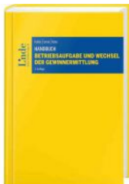
Handbuch Betriebsaufgabe und Wechsel der Gewinnermittlung Ladenpreis: 64,00 EUR