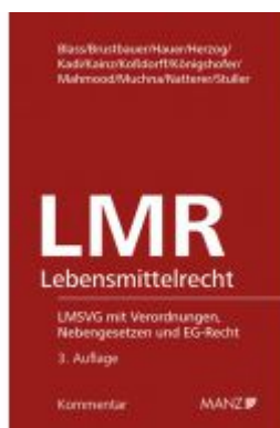
Lebensmittelrecht 3.Auflage Ladenpreis: 328,00 EUR