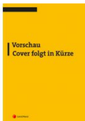
Strafrecht - Allgemeiner Teil I (Skriptum) Ladenpreis: 17,00 EUR