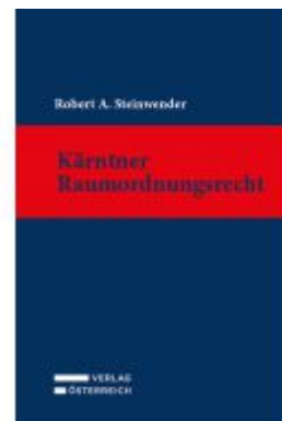
Kärntner Raumordnungsrecht Ladenpreis: 166,00EUR