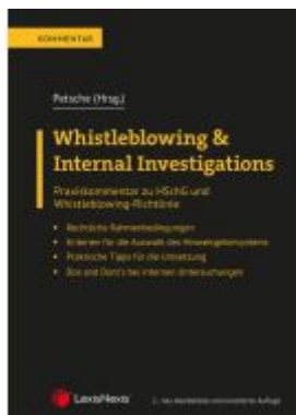
Whistleblowing & Internal Investigations Ladenpreis: 76,00EUR