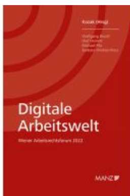
Digitale Arbeitswelt Ladenpreis: 34,00EUR