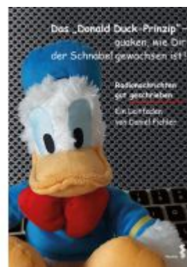
Das Donald Duck-Prinzip – quaken, wie Dir der Schnabel gewachsen ist! Ladenpreis: 13,40EUR