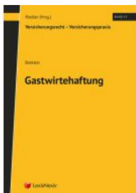
Gastwirtheftung Ladenpreis: 78,00EUR