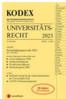
KODEX Universitätsrecht 2023 Ladenpreis: 62,00EUR