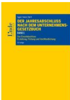
Der Jahresabschluss nach dem Unternehmensgesetzbuch, Band 1 Ladenpreis: 78,00EUR