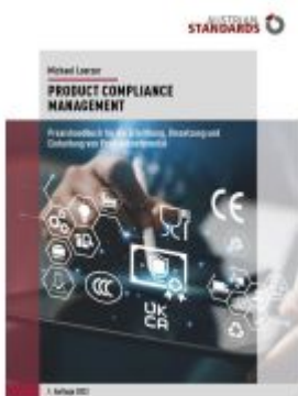
Product Compliance Management Ladenpreis: 75,90EUR