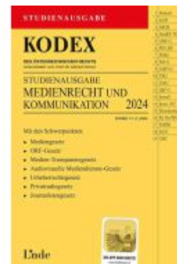
KODEX Studienausgabe Medienrecht und Kommunikation Ladenpreis: 15,00EUR