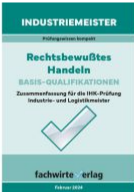
Industriemeister: Rechtsbewusstes Handeln Ladenpreis: 10,10EUR