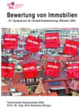
Bewertung von Immobilien Ladenpreis: 61,60EUR

Wir haben andere Produkte gefunden, die Ihnen gefallen könnten!