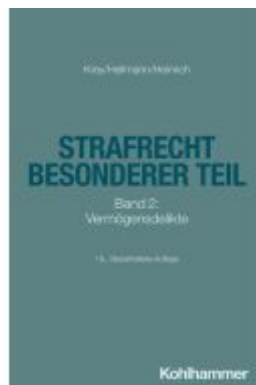
Strafrecht Besonderer Teil Ladenpreis: 30,80EUR