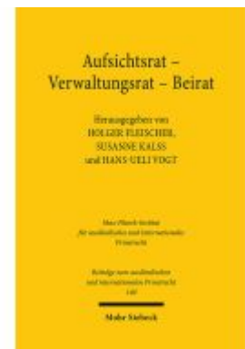
Aufsichtsrat - Verwaltungsrat - Beirat Ladenpreis: 107,00EUR