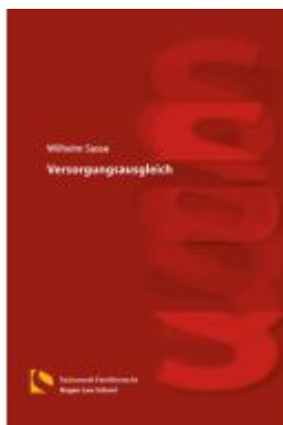
Versorgungsausgleich Ladenpreis: 46,30EUR