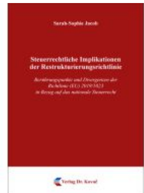
Steuerrechtliche Implikationen der Restrukturierungsrichtlinie Ladenpreis: 91,40EUR