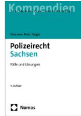
Polizeirecht Sachsen Ladenpreis: 29,80EUR