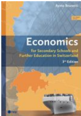
Economics (Print inkl. E-Book Edubase, Neuaufgabe 2025) Ladenpreis: 62,80EUR