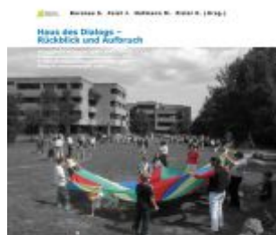
Haus des Dialogs – Rückblick und Aufbruch Ladenpreis: 19,90 EUR