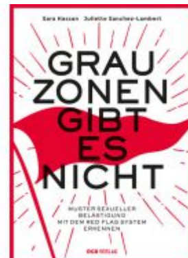
Grauzonen gibt es nicht Ladenpreis: 10,00 EUR