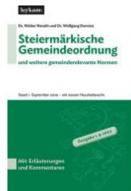
Steiermärkische Gemeindeordnung und weitere gemeinderelevante Normen Ladenpreis: 75,00 EUR