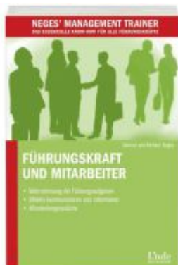
Führungskraft und Mitarbeiter Ladenpreis: 15,40 EUR

Wir haben andere Produkte gefunden, die Ihnen gefallen könnten!