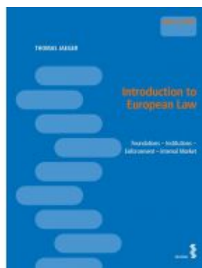
Introduction to European Law Ladenpreis: 22,00 EUR