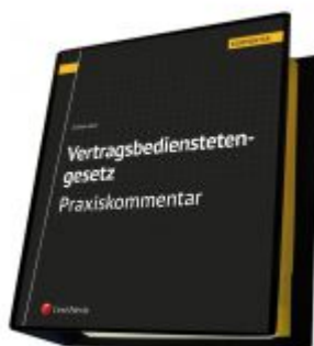
Vertragsbedienstetengesetz - Praxiskommentar Ladenpreis: 293,00 EUR