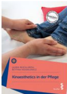
Kinaesthetics in der Pflege Ladenpreis: 29,90 EUR