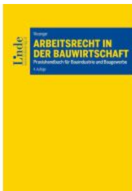
Arbeitsrecht in der Bauwirtschaft Ladenpreis: 52,00EUR