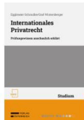
Internationales Privatrecht Ladenpreis: 38,00EUR