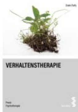
Verhaltenstherapie Ladenpreis: 16,90EUR