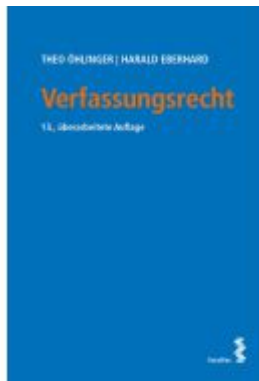
Verfassungsrecht Ladenpreis: 52,00EUR

Wir haben andere Produkte gefunden, die Ihnen gefallen könnten!