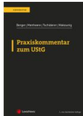
Praxiskommentar zum UStG Ladenpreis: 187,00EUR