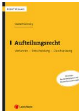
Aufteilungsrecht Ladenpreis: 39,00EUR