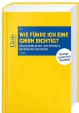
Wie führe ich eine GmbH richtig? Ladenpreis: 168,00EUR