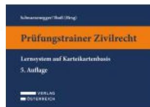
Prüfungstrainer Zivilrecht Ladenpreis: 49,00EUR