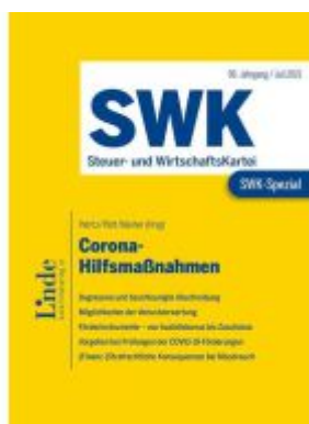
SWK-Spezial Corona-Hilfsmaßnahmen Ladenpreis: 60,00EUR