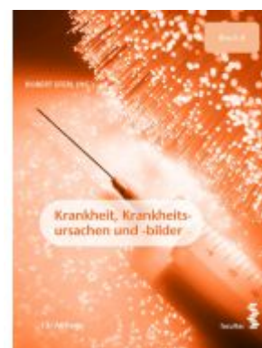
Krankheit, Krankheitsursachen und -bilder Ladenpreis: 36,90EUR