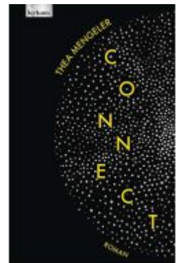
connect Ladenpreis: 24,00EUR