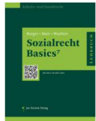
Sozialrecht Basics Ladenpreis: 39,90EUR