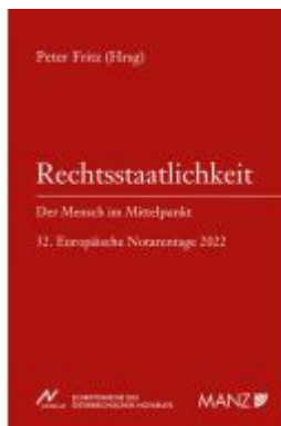
Rechtsstaatlichkeit - Der Mensch im Mittelpunkt Ladenpreis: 22,80EUR