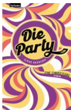
Die Party Ladenpreis: 22,00EUR