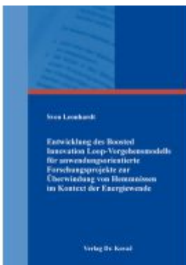
Entwicklung des Boosted Innovation Loop-Vorgehensmodells für anwendungsorientierte Forschungsprojekte zur Überwindung von Hemmnissen im Kontext der Energiewende Ladenpreis: 102,60EUR