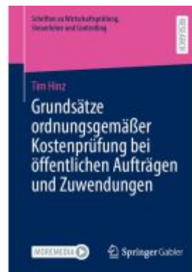
Grundsätze ordnungsgemäßer Kostenprüfung bei öffentlichen Aufträgen und Zuwendungen Ladenpreis: 82,23EUR