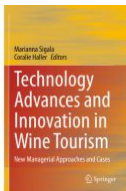
Technology Advances and Innovation in Wine Tourism Ladenpreis: 186,99EUR