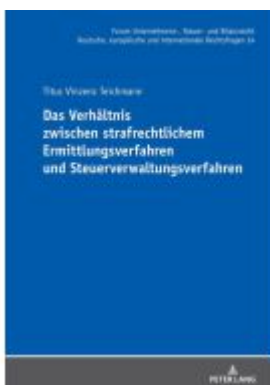
Das Verhältnis zwischen strafrechtlichem Ermittlungsverfahren und Steuerverwaltungsverfahren Ladenpreis: 56,50EUR