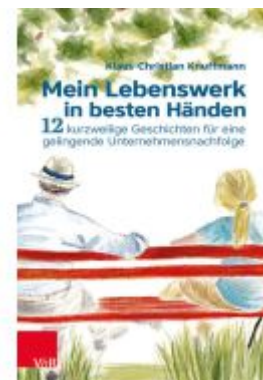
Mein Lebenswerk in besten Händen Ladenpreis: 26,00EUR