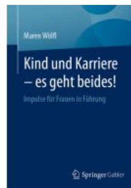
Kind und Karriere – es geht beides! Ladenpreis: 41,11EUR