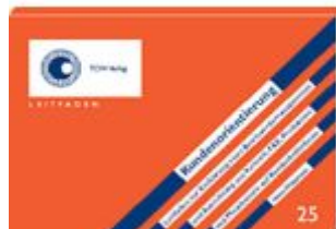
Kundenorientierung Ladenpreis: 257,10EUR