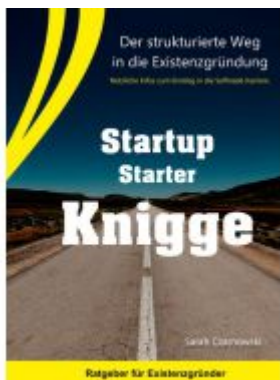
Startup Starter Knigge Ladenpreis: 9,20EUR

Wir haben andere Produkte gefunden, die Ihnen gefallen könnten!