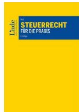
Steuerrecht für die Praxis Ladenpreis: 79,00EUR