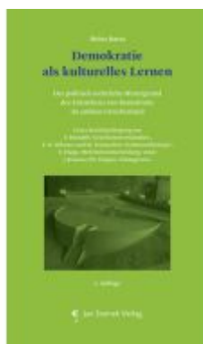
Demokratie als kulturelles Lernen Ladenpreis: 29,90EUR