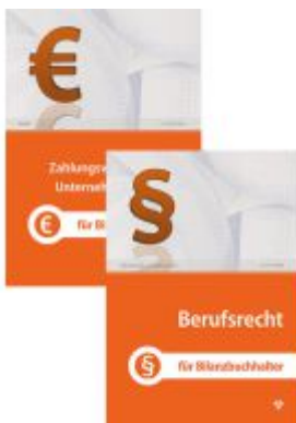
Set für Bilanzbuchhalter Ladenpreis: 60,50EUR