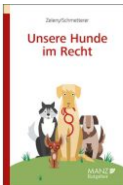
Unsere Hunde im Recht Ladenpreis: 23,80EUR