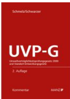
UVP-Gesetz Umweltverträglichkeitsprüfungsgesetz 2000 Aktionspreis: 278,00EUR Ladenpreis: 348,00EUR