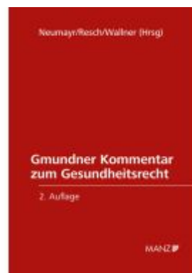
Gmundner Kommentar zum Gesundheitsrecht Ladenpreis: 528,00EUR