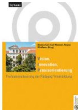
Vision Innovation Praxisorientierung Professionalisierung der Pädagog*innenbildung Ladenpreis: 35,00EUR