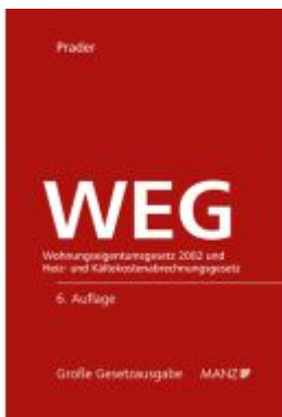
WEG - Wohnungseigentumsgesetz 2002 und HeizKG Ladenpreis: 208,00EUR

Wir haben andere Produkte gefunden, die Ihnen gefallen könnten!