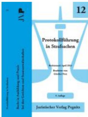
Protokollführung in Strafsachen Ladenpreis: 22,70EUR

Wir haben andere Produkte gefunden, die Ihnen gefallen könnten!