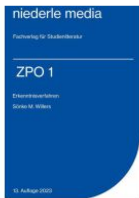
ZPO I Erkenntnisverfahren - 2023 Ladenpreis: 13,30EUR