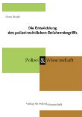
Die Entwicklung des polizeirechtlichen Gefahrenbegriffs Ladenpreis: 27,70EUR