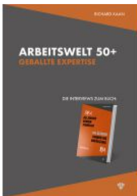
Arbeitswelt 50+: Geballte Expertise – Die Interviews Ladenpreis: 28,00EUR