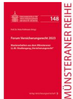
Forum Versicherungsrecht 2023 Ladenpreis: 66,70EUR