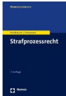
Strafprozessrecht Ladenpreis: 27,70EUR