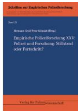
Empirische Polizeiforschung XXV: Ladenpreis: 35,90EUR