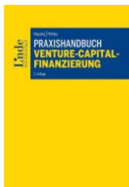
Praxishandbuch Venture-Capital- Finanzierung Ladenpreis: 59,00EUR