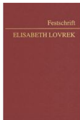
Festschrift Elisabeth Lovrek Ladenpreis: 228,00EUR