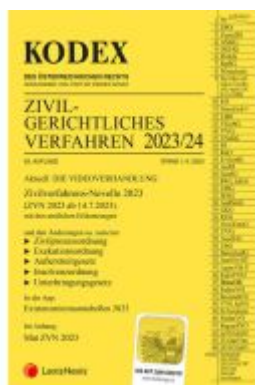
KODEX Zivilgerichtliches Verfahren 2023/24 - inkl. App Ladenpreis: 43,00EUR