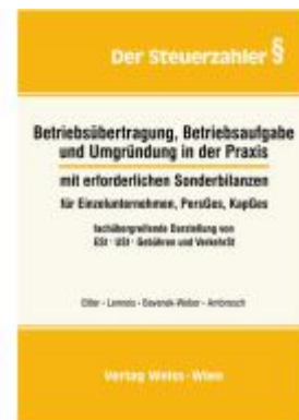
Betriebsübertragung, Betriebsaufgabe und Umgründung in der Praxis Ladenpreis: 82,50EUR