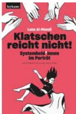
Klatschen reicht nicht! Ladenpreis: 22,00EUR