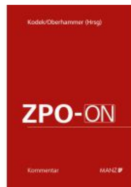
ZPO-ON Ladenpreis: 470,00EUR