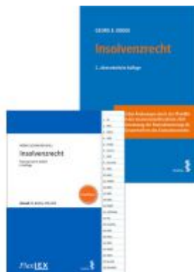
Kombipaket Insolvenzrecht und FlexLex Insolvenzrecht | Studium Ladenpreis: 47,00EUR