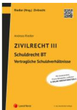
Zivilrecht III - Schuldrecht Besonderer Teil - Vertragliche Schuldverhältnisse Ladenpreis: 35,00EUR