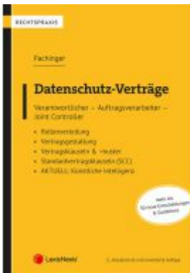
Datenschutz-Verträge Ladenpreis: 69,00EUR