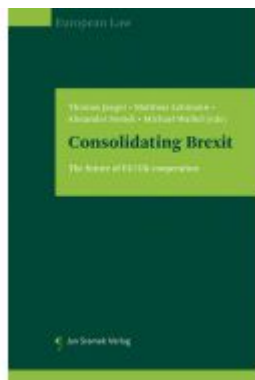
Consolidating Brexit Ladenpreis: 85,00EUR

Wir haben andere Produkte gefunden, die Ihnen gefallen könnten!