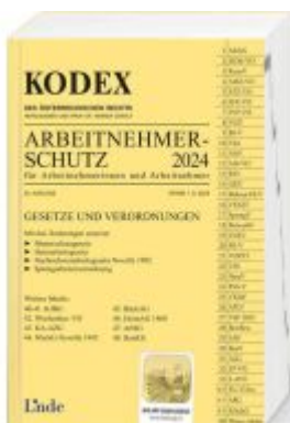
KODEX Arbeitnehmerschutz 2024 Ladenpreis: 42,00EUR