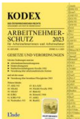
KODEX Arbeitnehmerschutz 2023 Ladenpreis: 41,00EUR