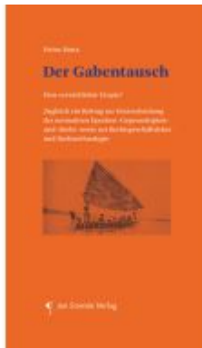
Der Gabentausch Ladenpreis: 24,90EUR