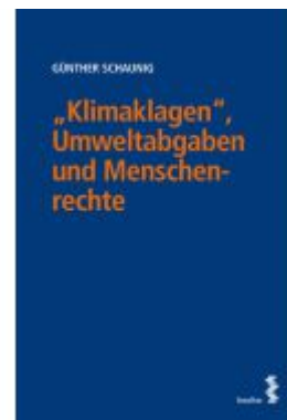
„Klimaklagen“, Umweltabgaben und Menschenrechte Ladenpreis: 44,00EUR