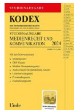
KODEX Studienausgabe Medienrecht und Kommunikation Ladenpreis: 15,00EUR