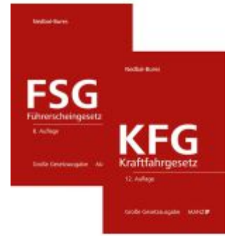
PAKET: Kraftfahrzeuggesetz 12. Aufl + Führerscheingesetz 8. Aufl Ladenpreis: 220,00EUR