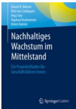
Nachhaltiges Wachstum im Mittelstand