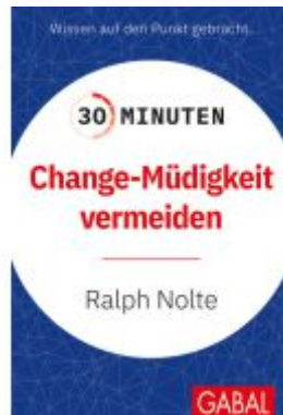
30 Minuten Change-Müdigkeit vermeiden Ladenpreis: 11,30EUR