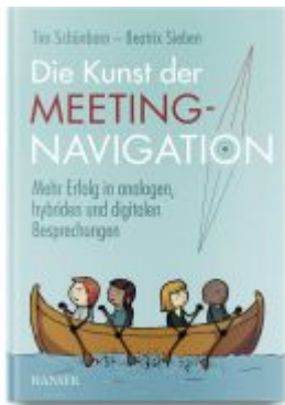
Die Kunst der Meeting-Navigation Ladenpreis: 51,40EUR