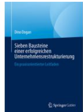
Sieben Bausteine einer erfolgreichen Unternehmensrestrukturierung Ladenpreis: 41,11EUR