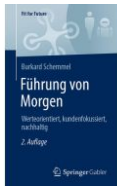
Führung von Morgen Ladenpreis: 39,06EUR