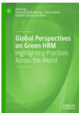
Global Perspectives on Green HRM