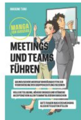
Manga for Success - Meetings und Teams führen