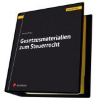
Gesetzmateriale zum Steuerrecht Ladenpreis: 160,00 EUR