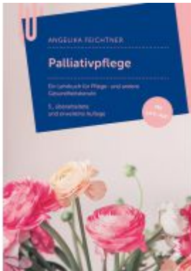
Palliativpflege Ladenpreis: 28,90 EUR

Wir haben andere Produkte gefunden, die Ihnen gefallen könnten!