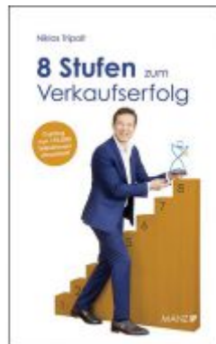
8 Stufen zum Verkaufserfolg Ladenpreis: 21,80 EUR