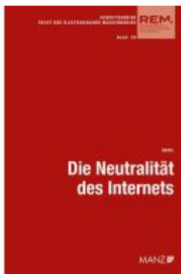
Die Neutralität des Internets Ladenpreis: 68,00 EUR