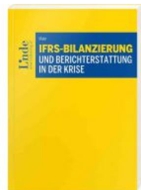
IFRS-Bilanzierung und Berichterstattung in der Krise Ladenpreis: 56,00 EUR