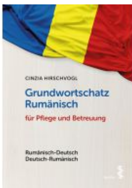
Grundwortschatz Rumänisch für Pflege und Betreuung Ladenpreis: 18,90 EUR