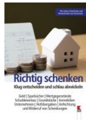
Richtig schenken Ladenpreis: 19,90 EUR