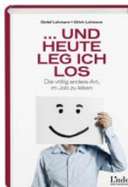
... und heute leg ich los Ladenpreis: 19,90 EUR