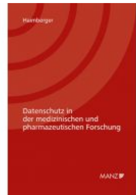
Datenschutz in der medizinischen und pharmazeutischen Forschung Ladenpreis: 64,00 EUR