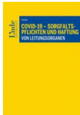
COVID-19 - Sorgfaltspflichten und Haftung von Leitungsorganen Ladenpreis: 39,00 EUR