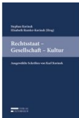
Rechtsstaat - Gesellschaft - Kultur Ladenpreis: 69,00 EUR