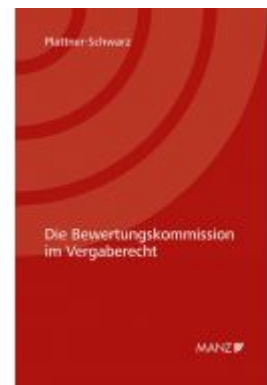
Die Bewertungskommission im Vergaberecht Ladenpreis: 118,00 EUR