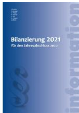
Bilanzierung 2021 Ladenpreis: 44,90 EUR