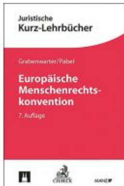
Europäische Menschenrechtskonvention Ladenpreis: 39,00 EUR