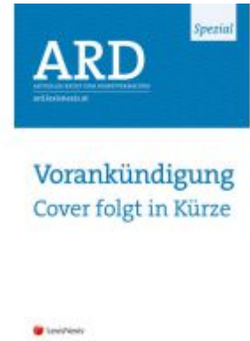
Personalmaßnahmen in Krisenzeiten Ladenpreis: 36,00 EUR