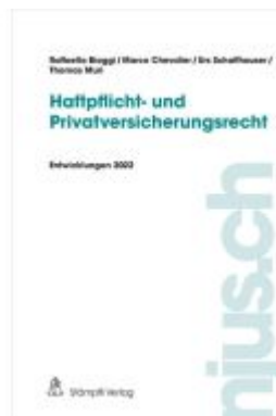
Haftpflicht- und Privatversicherungsrecht Ladenpreis: 81,20EUR