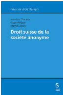
Droit suisse de la société anonyme Ladenpreis: 257,50EUR