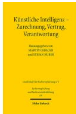
Künstliche Intelligenz - Zurechnung, Vertrag, Verantwortung Ladenpreis: 60,70EUR