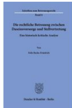
Die rechtliche Betreuung zwischen Daseinsvorsorge und Stellvertretung. Ladenpreis: 71,90EUR