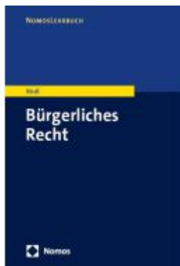
Bürgerliches Recht Ladenpreis: 27,70EUR