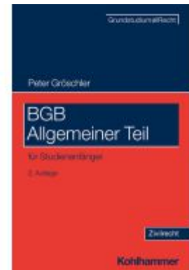
BGB Allgemeiner Teil Ladenpreis: 28,80EUR