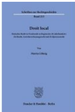
Droit local. Ladenpreis: 71,90EUR