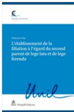
L'établissement de la filiation à l'égard du second parent de lege lata et de lege ferenda Ladenpreis: 151,70EUR