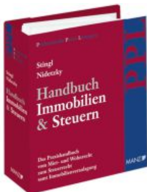
PAKET: Handbuch Immobilien & Steuern Ladenpreis: 278,00EUR

Wir haben andere Produkte gefunden, die Ihnen gefallen könnten!