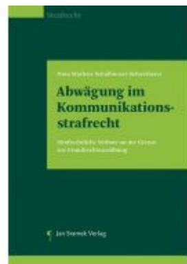
Abwägungen im Kommunikationsstrafrecht Ladenpreis: 148,00EUR