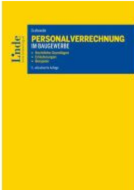
Personalverrechnung im Baugewerbe Ladenpreis: 74,00EUR