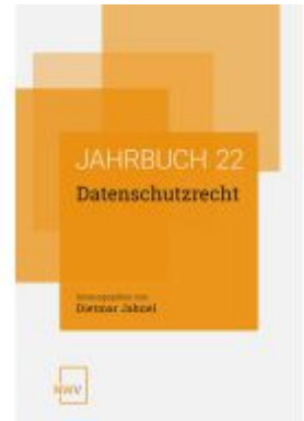
Datenschutzrecht Ladenpreis: 64,00EUR