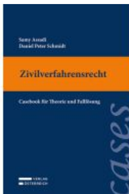
Zivilverfahrensrecht Ladenpreis: 39,00EUR