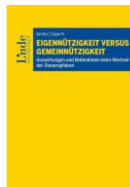
Eigennützigkeit versus Gemeinnützigkeit Ladenpreis: 39,00EUR