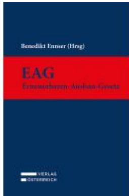
EAG - Erneuerbaren-Ausbau-Gesetz Ladenpreis: 89,00EUR