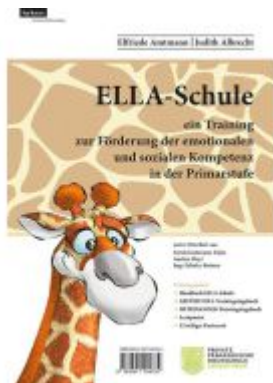
ELLA - Schule - ein Training zur Förderung der emotionalen und sozialen Kompetenz in der Primarstufe Ladenpreis: 42,00EUR

Wir haben andere Produkte gefunden, die Ihnen gefallen könnten!