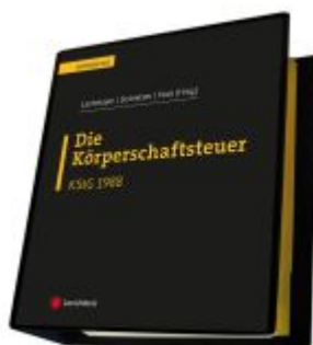
Die Körperschaftsteuer (KStG 1988) Ladenpreis: 450,00EUR