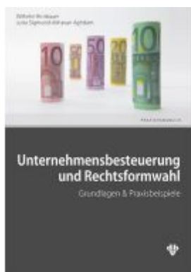
Unternehmensbesteuerung und Rechtsformwahl Ladenpreis: 46,00EUR