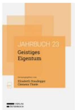
Geistiges Eigentum Ladenpreis: 78,00EUR