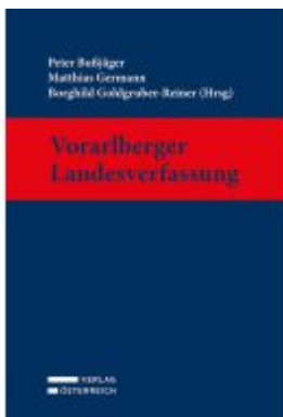
Vorarlberger Landesverfassung Ladenpreis: 259,00EUR