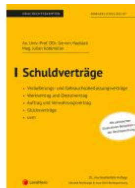
Schuldverträge (Skriptum) Ladenpreis: 30,00EUR