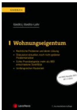
Wohnungseigentum Ladenpreis: 99,00EUR

Wir haben andere Produkte gefunden, die Ihnen gefallen könnten!