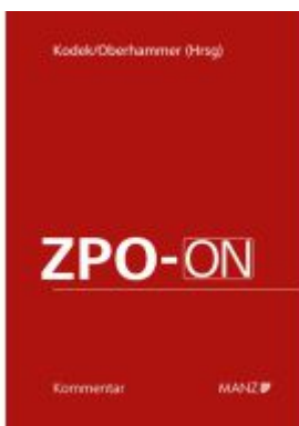
ZPO-ON Ladenpreis: 470,00EUR