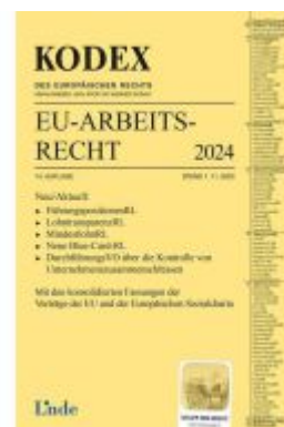
KODEX EU-Arbeitsrecht 2024 Ladenpreis: 72,00EUR