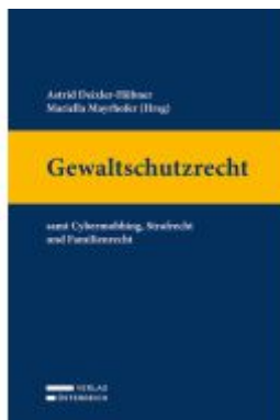
Gewaltschutzrecht Ladenpreis: 89,00EUR