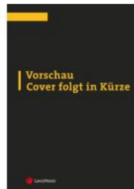
IZVR Praxiskommentar Internationales Zivilverfahrensrecht Ladenpreis: 139,00EUR