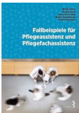
Fallbeispiele für Pflegeassistenz und Pflegefachassistenz Ladenpreis: 24,90EUR