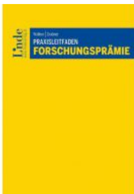
Praxisleitfaden Forschungsprämie Ladenpreis: 58,00EUR