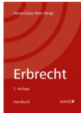
Erbrecht Ladenpreis: 160,00EUR