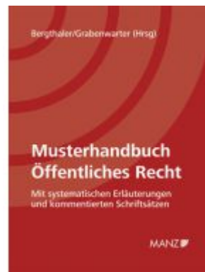
Musterhandbuch Öffentliches Recht Ladenpreis: 248,00EUR