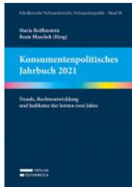
Konsumentenpolitisches Jahrbuch 2021 Ladenpreis: 89,00EUR