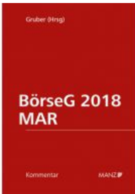
BörseG 2018/MAR Ladenpreis: 358,00EUR