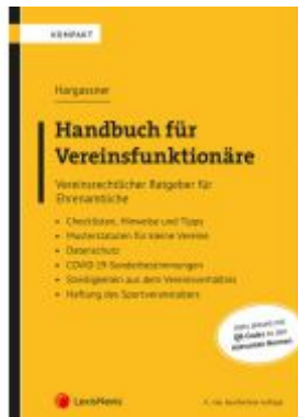
Handbuch für Vereinsfunktionäre Ladenpreis: 49,00EUR