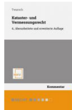
Kataster- und Vermessungsrecht Ladenpreis: 58,00EUR