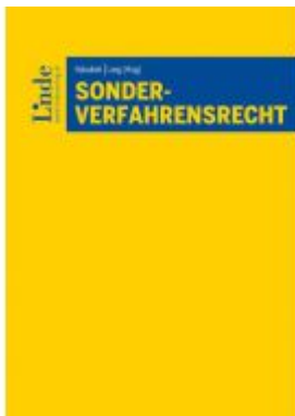
Sonderverfahrensrecht Ladenpreis: 125,00EUR

Wir haben andere Produkte gefunden, die Ihnen gefallen könnten!