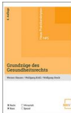
Grundzüge des Gesundheitsrechts Ladenpreis: 24,00 EUR