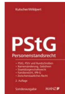
Das österreichische Personenstandsrecht Ladenpreis: 178,00 EUR