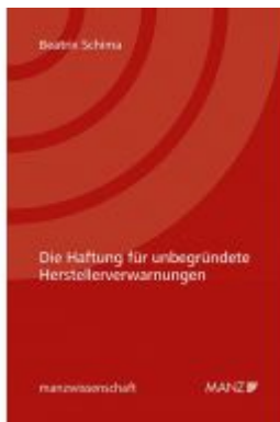
Die Haftung für unbegründete Herstellerverwarnungen Ladenpreis: 46,00 EUR