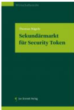
Sekundärmarkt für Security Token Ladenpreis: 29,90 EUR

Wir haben andere Produkte gefunden, die Ihnen gefallen könnten!