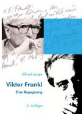
Viktor Frankl Ladenpreis: 19,90EUR