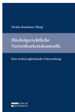
Höchstgerichtliche Vertretbarkeitskontrolle Ladenpreis: 49,00EUR