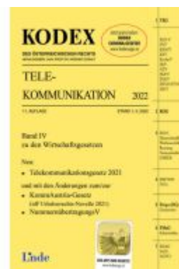
KODEX Telekommunikation 2022 Ladenpreis: 83,00EUR