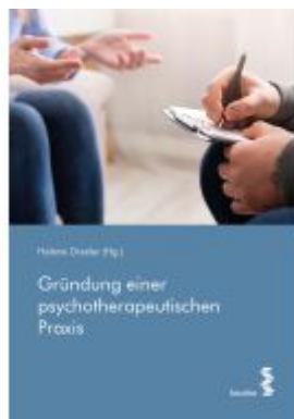
Gründung einer psychotherapeutischen Praxis Ladenpreis: 24,90EUR