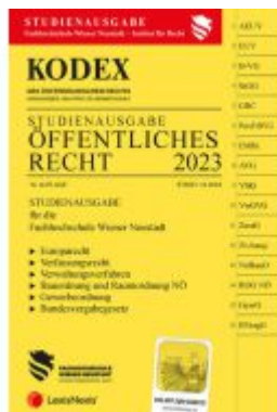
KODEX Öffentliches Recht 2023 - inkl. App Ladenpreis: 21,50EUR