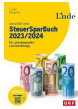
SteuerSparBuch 2023/2024 Ladenpreis: 29,90EUR