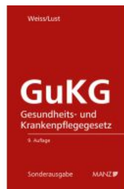
Gesundheits- und Krankenpflegegesetz GuKG Ladenpreis: 54,00EUR