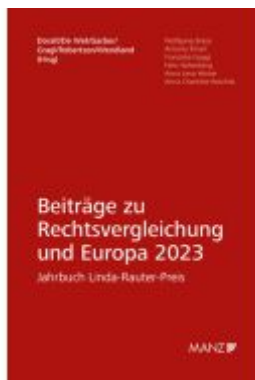
Beiträge zur Rechtsvergleichung und Europa 2023 Jahrbuch Linda-Rauter-Preis Ladenpreis: 94,00EUR