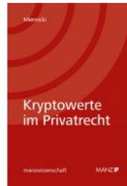
Kryptowerte im Privatrecht Ladenpreis: 238,00EUR