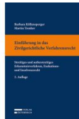
Einführung in das Zivilgerichtliche Verfahrensrecht Ladenpreis: 27,00EUR