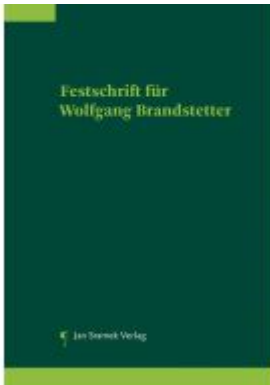
Festschrift für Wolfgang Brandstetter Ladenpreis: 148,00EUR