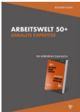
Arbeitswelt 50+: Geballte Expertise – Die Interviews Ladenpreis: 28,00EUR

Wir haben andere Produkte gefunden, die Ihnen gefallen könnten!