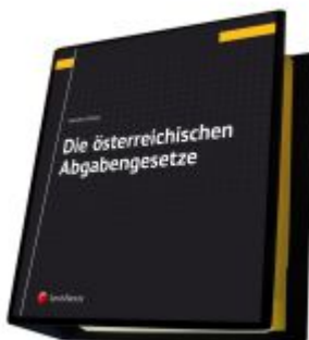
Die österreichischen Abgabengesetze Ladenpreis: 142,00EUR