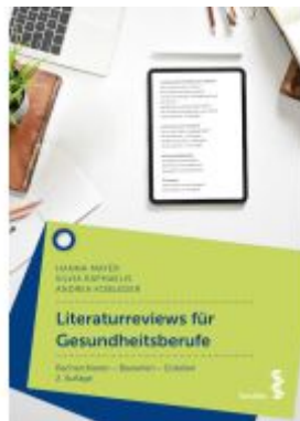
Literaturreviews für Gesundheitsberufe Ladenpreis: 28,90EUR