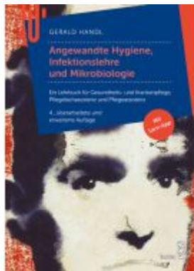
Angewandte Hygiene Ladenpreis: 31,90 EUR