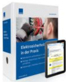
Elektrosicherheit in der Praxis Ladenpreis: 273,90 EUR