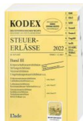
KODEX Steuer-Erlässe 2022 Band III Ladenpreis: 61,00 EUR