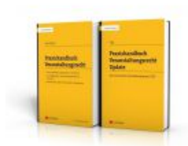
Praxishandbuch Veranstaltungsrecht + Update Ladenpreis: 79,00 EUR