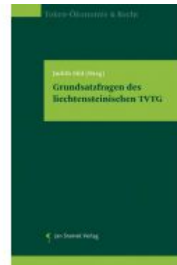
Grundsatzfragen des Liechtensteinischen TVTG Ladenpreis: 98,00 EUR