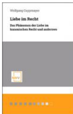
Liebe im Recht Ladenpreis: 48,00 EUR