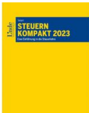
Steuern kompakt 2023 Ladenpreis: 32,00EUR