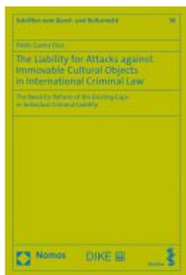
The Liability for Attacks against Immovable Cultural Objects in International Criminal Law Ladenpreis: 132,70EUR