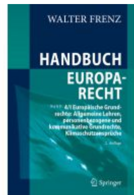
Handbuch Europarecht Ladenpreis: 154,20EUR