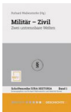
Militär — Zivil Ladenpreis: 88,00EUR