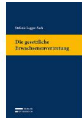
Die gesetzliche Erwachsenenvertretung Ladenpreis: 79,00EUR