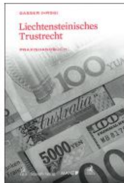
Liechtensteinisches Trustrecht Ladenpreis: 99,00EUR