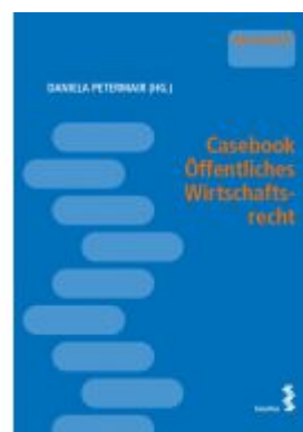
Casebook Öffentliches Wirtschaftsrecht Ladenpreis: 28,00EUR