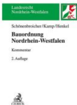
Bauordnung Nordrhein-Westfalen Ladenpreis: 142,90EUR