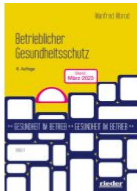
Betrieblicher Gesundheitsschutz Ladenpreis: 25,70EUR