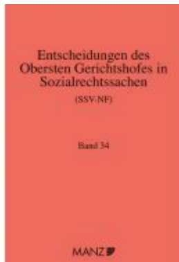
Entscheidungen des obersten Gerichtshofes in Sozialrechtssachen SSV- NF Ladenpreis: 159,80EUR