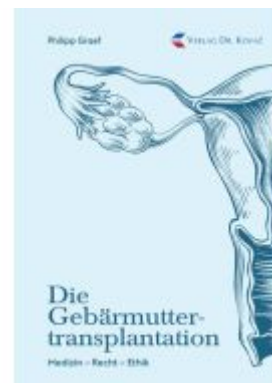
Die Gebärmuttertransplantation Ladenpreis: 100,60EUR