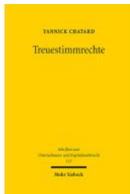
Treuestimmrechte Ladenpreis: 101,80EUR