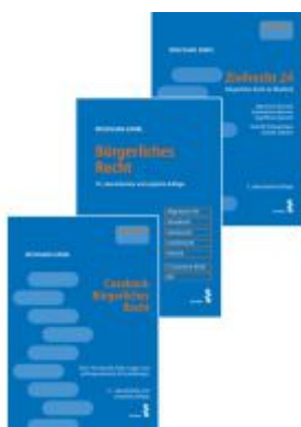
Kombipaket Casebook Bürgerliches Recht, Bürgerliches Recht und Zivilrecht 24 Ladenpreis: 94,00EUR