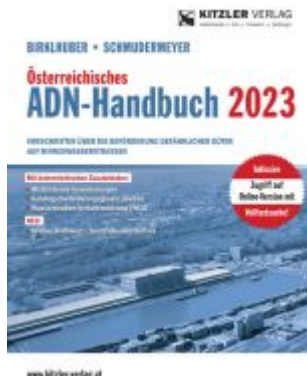
ADN-Handbuch 2023 Ladenpreis: 115,50EUR

Wir haben andere Produkte gefunden, die Ihnen gefallen könnten!