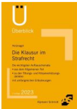
Die Klausur im Strafrecht Ladenpreis: 7,20EUR