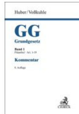
Grundgesetz Bd. 1: Präambel, Artikel 1-19 Ladenpreis: 287,90EUR