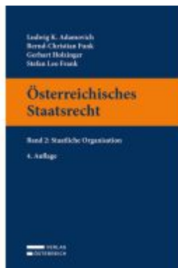
Österreichisches Staatsrecht Ladenpreis: 55,00EUR