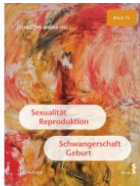
Sexualität, Reproduktion, Schwangerschaft, Geburt Ladenpreis: 29,50EUR