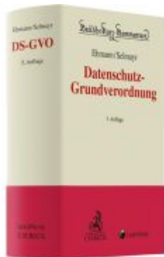
Datenschutz-Grundverordnung Ladenpreis: 179,00EUR

Wir haben andere Produkte gefunden, die Ihnen gefallen könnten!