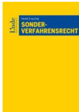
Sonderverfahrensrecht Ladenpreis: 125,00EUR