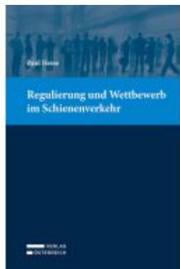
Regulierung und Wettbewerb im Schienenverkehr Ladenpreis: 69,00EUR