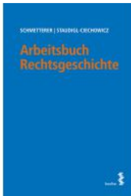
Arbeitsbuch Rechtsgeschichte Ladenpreis: 14,00EUR