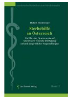
Sterbehilfe In Österreich Ladenpreis: 128,00EUR