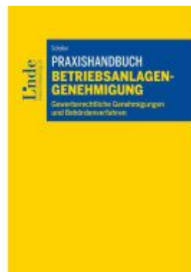
Praxishandbuch Betriebsanlagengenehmigung Ladenpreis: 39,00EUR