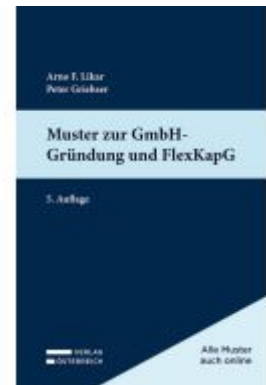
Muster zur GmbH-Gründung und FlexKapG Ladenpreis: 54,00EUR