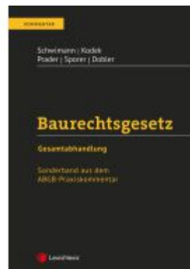
Baurechtsgesetz Ladenpreis: 82,00EUR