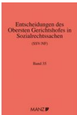
Entscheidungen des obersten Gerichtshofes in Sozialrechtssachen SSV- NF Ladenpreis: 164,80EUR