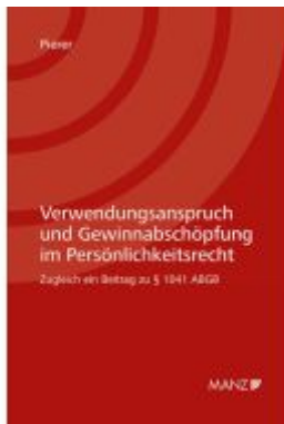
Verwendungsanspruch und Gewinnabschöpfung im Persönlichkeitsrecht Ladenpreis: 44,00EUR