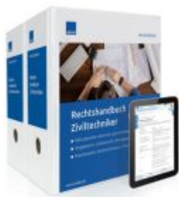
Rechtshandbuch Ziviltechniker Ladenpreis: 239,80EUR