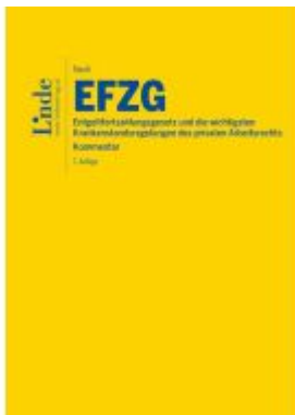
EFZG | Entgeltfortzahlungsgesetz Ladenpreis: 58,00EUR

Wir haben andere Produkte gefunden, die Ihnen gefallen könnten!