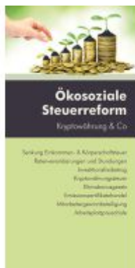
Ökosoziale Steuerreform Ladenpreis: 12,60EUR