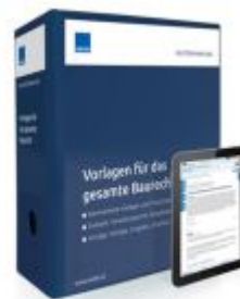
Vorlagen für das gesamte Baurecht Ladenpreis: 250,80EUR