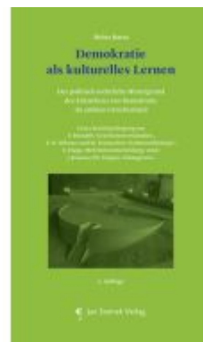
Demokratie als kulturelles Lernen Ladenpreis: 29,90EUR