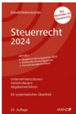
Steuerrecht 2024 Ladenpreis: 39,00EUR