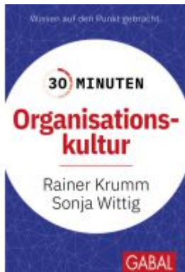
30 Minuten Organisationskultur Ladenpreis: 11,30EUR

Wir haben andere Produkte gefunden, die Ihnen gefallen könnten!