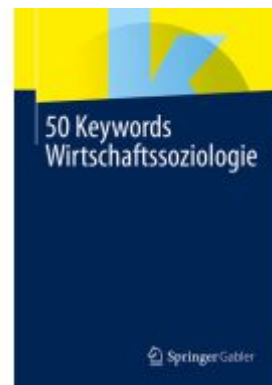
50 Keywords Wirtschaftssoziologie Ladenpreis: 20,55EUR