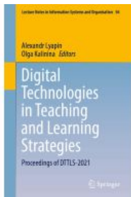
Digital Technologies in Teaching and Learning Strategies Ladenpreis: 186,99EUR