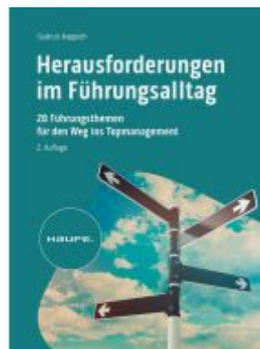
Herausforderungen im Führungsalltag Ladenpreis: 41,20EUR