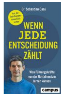
Wenn jede Entscheidung zählt Ladenpreis: 28,80EUR