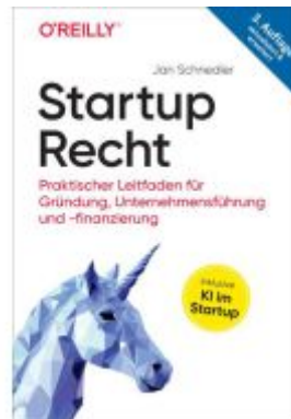
Startup-Recht Ladenpreis: 46,20EUR