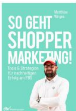
So geht Shopper Marketing! Ladenpreis: 43,20EUR