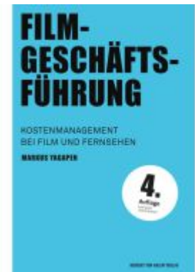
Filmgeschäftsführung Ladenpreis: 32,90EUR