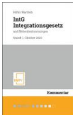
IntG Integrationsgesetz Ladenpreis: 68,00 EUR