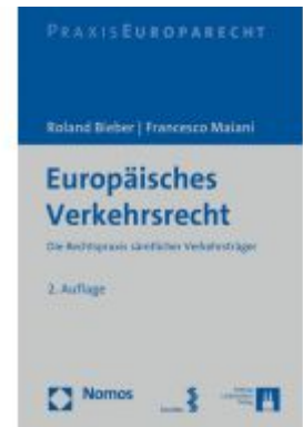
Europäisches Verkehrsrecht Ladenpreis: 91,50 EUR