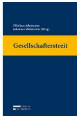
Gesellschafterstreit Ladenpreis: 249,00 EUR