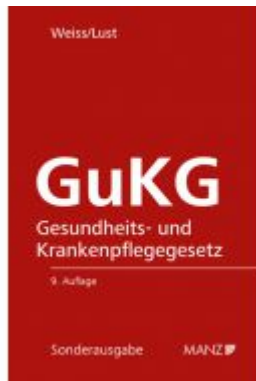
Gesundheits- und Krankenpflegegesetz GuKG Ladenpreis: 54,00 EUR

Wir haben andere Produkte gefunden, die Ihnen gefallen könnten!