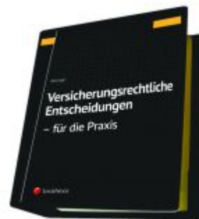
Versicherungsrechtliche Entscheidungen - aufbereitet für die Praxis Ladenpreis: 329,00 EUR