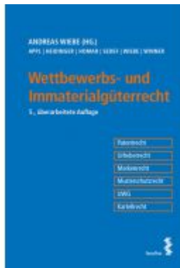
Wettbewerbs- und Immaterialgüterrecht Ladenpreis: 45,00 EUR