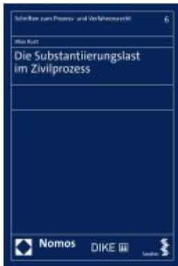
Die Substantiierungslast im Zivilprozess Ladenpreis: 55,60 EUR