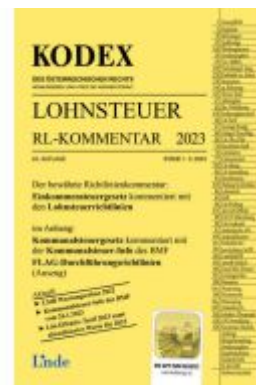
KODEX Lohnsteuer Richtlinien-Kommentar 2023 Ladenpreis: 62,00EUR