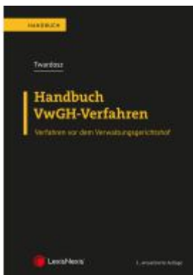
Handbuch VwGH-Verfahren Ladenpreis: 69,00EUR