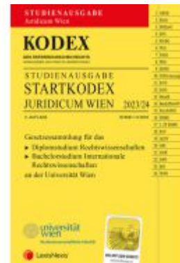
KODEX Startkodex Wien Juridicum 2023/24 - inkl. App Ladenpreis: 19,00EUR