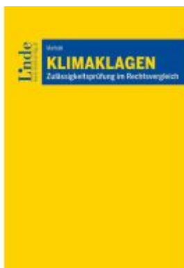
Klimaklagen Ladenpreis: 38,00EUR