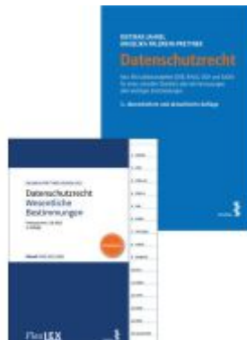
Kombipaket Datenschutzrecht und FlexLex Datenschutzrecht – Wesentliche Bestimmungen Ladenpreis: 38,00EUR