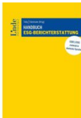
Handbuch ESG-Berichterstattung Ladenpreis: 159,00EUR