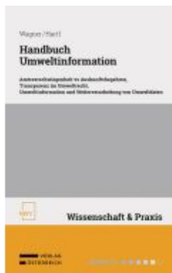
Handbuch Umweltinformation Ladenpreis: 88,00EUR