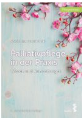
Palliativpflege in der Praxis Ladenpreis: 26,90EUR