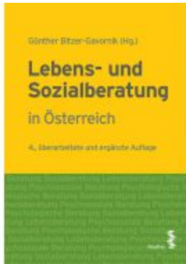
Lebens- und Sozialberatung Ladenpreis: 32,90 EUR

Wir haben andere Produkte gefunden, die Ihnen gefallen könnten!