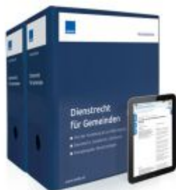
Dienstrecht für Gemeinden Ladenpreis: 250,80EUR