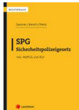
SPG - Sicherheitspolizeigesetz Ladenpreis: 39,00EUR