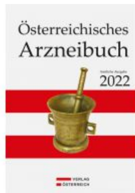
Österreichisches Arzneibuch Ladenpreis: 72,42 EUR