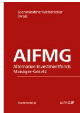
Alternative Investmentfonds Manager-Gesetz AIFMG