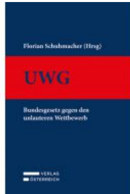
UWG Ladenpreis: 169,00 EUR