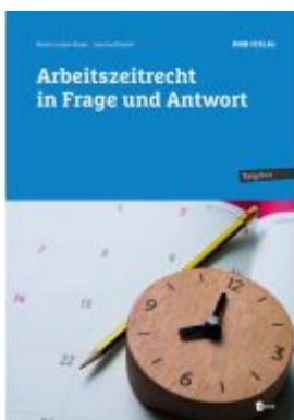
Arbeitszeitrecht in Frage und Antwort Ladenpreis: 36,00EUR