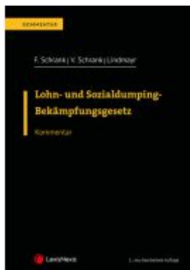
Lohn- und Sozialdumping-Bekämpfungsgesetz LSD-BG