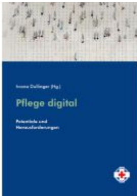
Pflege digital Ladenpreis: 16,90 EUR