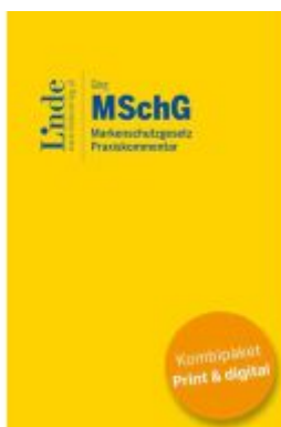
MSchG I Markenschutzgesetz (Kombi Print&digital) Ladenpreis: 99,00EUR