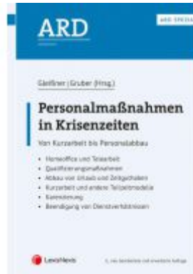
Personalmaßnahmen in Krisenzeiten Ladenpreis: 38,00 EUR