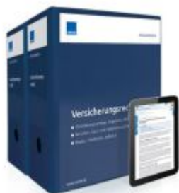
Versicherungsrecht Ladenpreis: 261,80EUR

Wir haben andere Produkte gefunden, die Ihnen gefallen könnten!