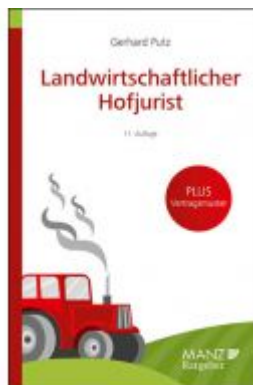
Landwirtschaftlicher Hofjurist Ladenpreis: 23,80 EUR