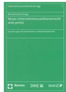
Neues Unternehmensanktionenrecht ante portas Ladenpreis: 49,00 EUR