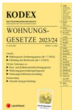
KODEX Wohnungsgesetze 2023/24 - inkl. App