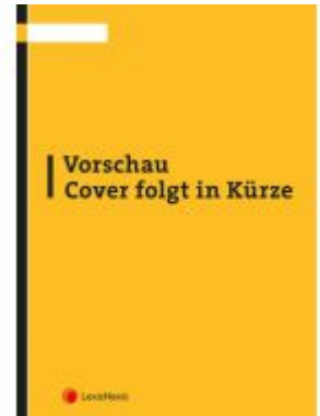
Aufteilungsrecht Ladenpreis: 36,00 EUR