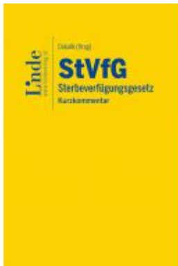
StVfG | Sterbeverfügungsgesetz Ladenpreis: 39,00 EUR