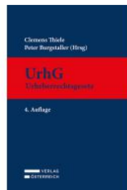
UrhG Urheberrechtsgesetz Ladenpreis: 415,00EUR