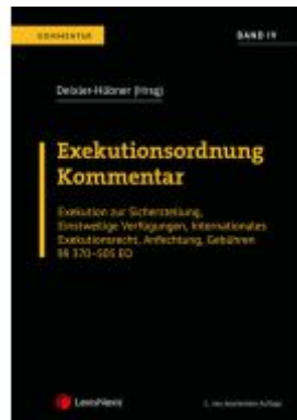
Exekutionsordnung - Kommentar Band 4 Ladenpreis: 164,00EUR