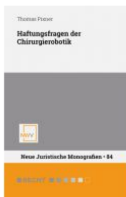
Haftungsfragen der Chirurgierobotik Ladenpreis: 54,00EUR