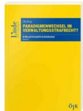
Paradigmenwechsel im Verwaltungsstrafrecht? Ladenpreis: 22,00EUR