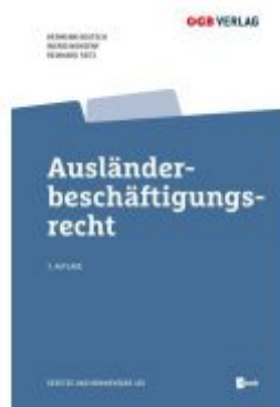
Ausländerbeschäftigungsrecht Ladenpreis: 89,00EUR