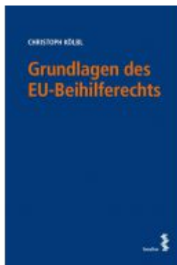
Grundlagen des EU-Beihilferechts Ladenpreis: 48,00EUR