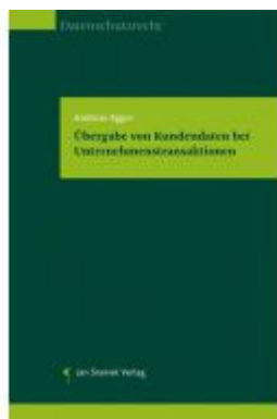
Übergabe von Kundendaten bei Unternehmenstransaktionen Ladenpreis: 37,50EUR