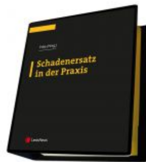
Schadenersatz in der Praxis Ladenpreis: 299,00EUR