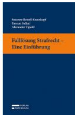
Falllösung Strafrecht - Eine Einführung Ladenpreis: 32,00EUR