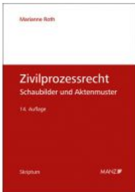
Zivilprozessrecht Schaubilder und Aktenmuster Ladenpreis: 42,00EUR

Wir haben andere Produkte gefunden, die Ihnen gefallen könnten!