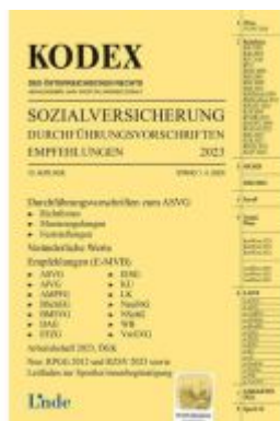
KODEX Sozialversicherung 2023, Band III Ladenpreis: 37,00EUR