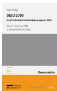
StEG 2005 Strafrechtliches Entschädigungsgesetz 2005 Ladenpreis: 58,00EUR