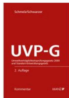
UVP-Gesetz Umweltverträglichkeitsprüfungsgesetz 2000 und Standortentwicklungsgesetz 2000 Aktionspreis: 278,00EUR Ladenpreis: 348,00EUR