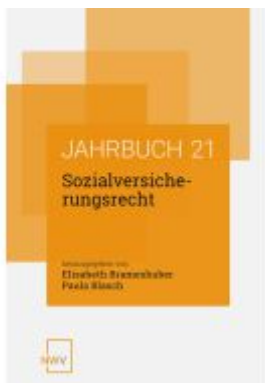
Sozialversicherungsrecht Ladenpreis: 62,00EUR