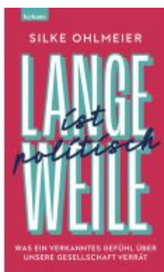
Langeweile ist politisch. Was ein verkanntes Gefühl über unsere Gesellschaft verrät Ladenpreis: 23,50EUR