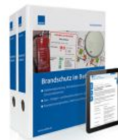
Brandschutz im Betrieb Ladenpreis: 239,80EUR