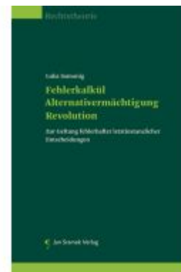
Fehlerkalkül – Alternativermächtigung – Revolution Ladenpreis: 39,90EUR