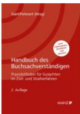
Handbuch des Buchsachverständigen Ladenpreis: 118,00EUR