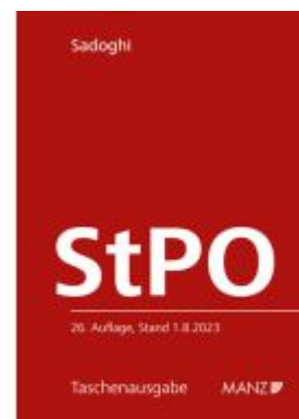
Strafprozessordnung StPO Ladenpreis: 24,80EUR