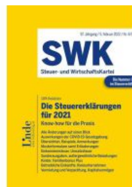
Die Steuererklärungen für 2021 Ladenpreis: 43,00EUR