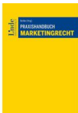
Praxishandbuch Marketingrecht Ladenpreis: 99,00EUR