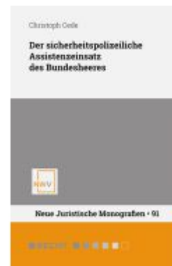
Der sicherheitspolizeiliche Assistenzinsatz des Bundesheeres Ladenpreis: 68,00EUR