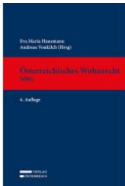
Österreichisches Wohnrecht - MRG Ladenpreis: 269,00EUR

Wir haben andere Produkte gefunden, die Ihnen gefallen könnten!