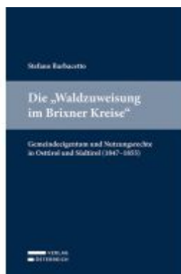
Die "Waldzuweisung im Brixner Kreise" Ladenpreis: 35,00EUR