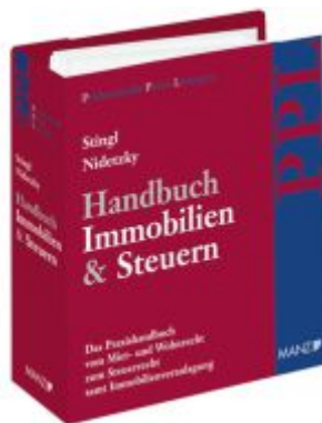
PAKET: Handbuch Immobilien & Steuern Ladenpreis: 278,00EUR