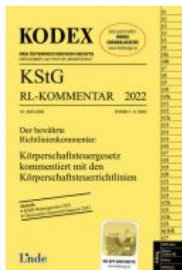
KODEX KStG Richtlinien-Kommentar 2022 Ladenpreis: 51,00 EUR