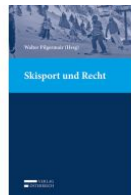
Skisport und Recht Ladenpreis: 75,00 EUR