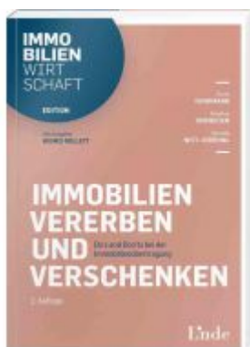
Immobilien vererben und verschenken Ladenpreis: 34,00 EUR