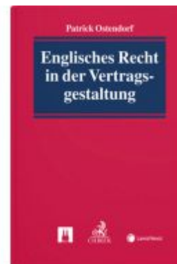
Englisches Recht in der Vertragsgestaltung Ladenpreis: 79,00 EUR