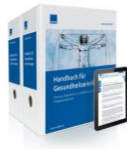
Handbuch für Gesundheitseinrichtungen Ladenpreis: 217,80 EUR