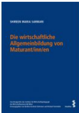
Die wirtschaftliche Allgemeinbildung von Maturant/inn/en Ladenpreis: 62,00EUR

Wir haben andere Produkte gefunden, die Ihnen gefallen könnten!