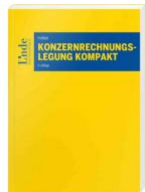
Konzernrechnungslegung kompakt Ladenpreis: 70,00EUR