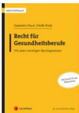
Recht für Gesundheitsberufe Ladenpreis: 48,00EUR