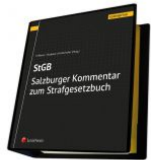
Salzburger Kommentar zum Strafgesetzbuch Ladenpreis: 498,00EUR