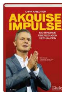
Akquise-Impulse Ladenpreis: 24,90EUR