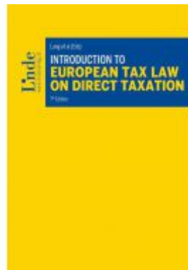
Introduction to European Tax Law on Direct Taxation Ladenpreis: 58,00EUR