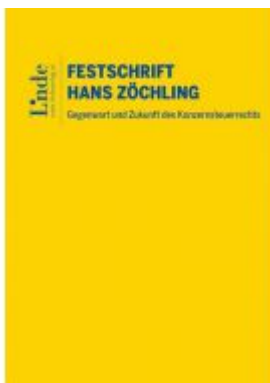
Gegenwart und Zukunft des Konzernsteuerrechts – Festschrift für Hans Zöchling Ladenpreis: 138,00EUR