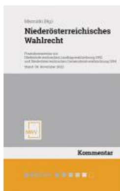
Niederösterreichisches Wahlrecht Ladenpreis: 118,00EUR