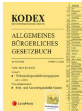
Taschen-Kodex ABGB 2022 - inkl. App Ladenpreis: 19,00EUR